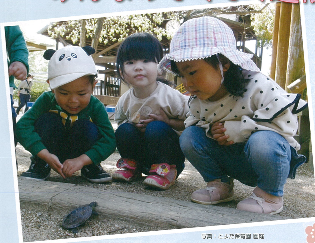
写真：とよた保育園 園庭