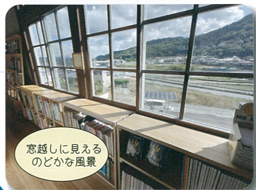
窓越しに見える のどかな風景