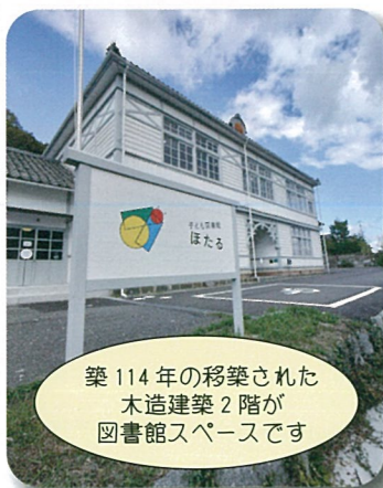
築114年の移築された 木造建築2階が 図書館スペースです