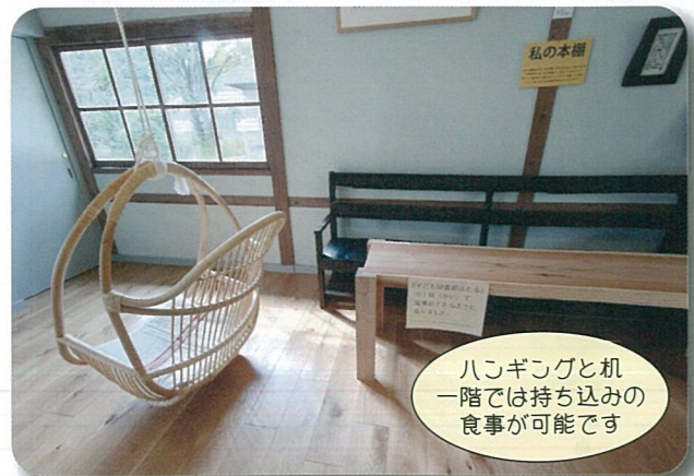
ハコギンゴと机 一階では持ち込みの 食事が可能です