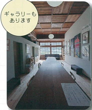
ギャラリーも あります