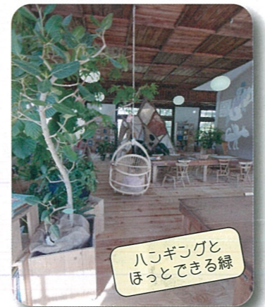
ハコギンゴと ほっとできる緑