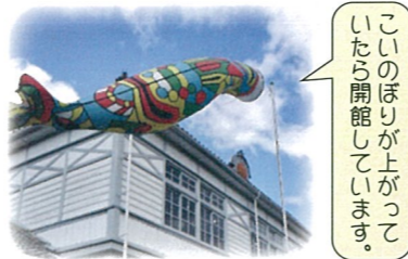
こいのぼりが上がって いたら開館しています。

例えば、小学生が何か小学生のために、ここでイベントを企画する等 ここでできることを自分たちで企画運営する。そんなことができたら うれしい。それを後押ししたい。 また、学校や仕事に行くのがちょっとしんどい時。ここにきて過ごす ことで、いろいろな人と交わり気持ちが変わるかもしれない。そんな場 所になったら素敵だと思う。