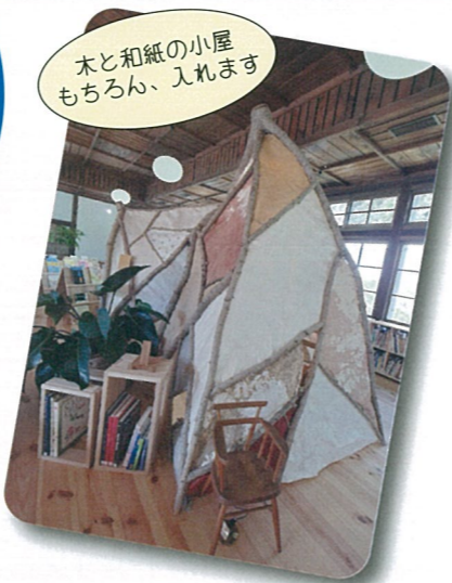
木と和紙の小屋 もちろん、入れます