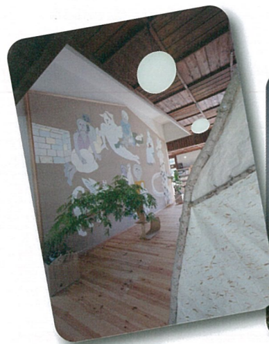
小さな子ども達の スペース