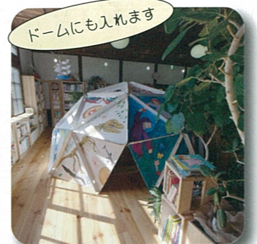
ドームにも入れます